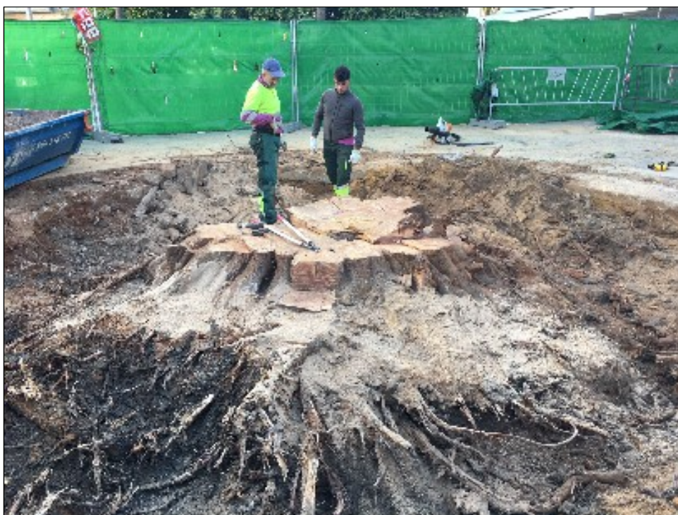
Foto: Vista general de la estructura radicular del Ficus nitida , Id 8, ubicado en Plaza de la Encarnación

En cualquier caso el sistema se desarrolla fundamentalmente en los niveles de cota primitiva de plantación, y como hemos comentado anteriormente existe una ausencia generalizada de raíces adventicias por lo que la respuesta del ejemplar a la migración de raíces hacia cotas superiores era deficiente, lo que le hubiera conferido mejor refuerzo basal de los ejes primarios así como la elevación del centro de gravedad del conjunto y por tanto una mejor estabilidad ante los episodios climáticos adversos.