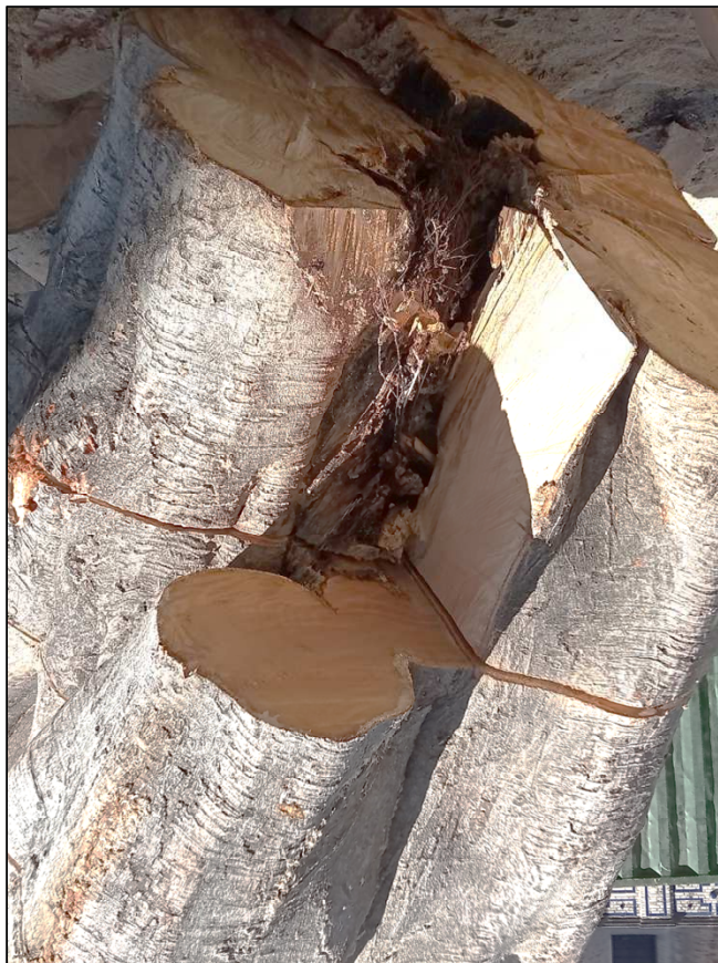
Foto: Profusa oquedad y pudrición que abarca desde las ramas primarias hasta el cuello radicular

Concretamente con el destocoado minucioso realizado por secciones transversales del tocón se ha comprobado que la oquedad central era continua desde el exterior en la zona de inserción de las ramas primarias principales hasta la zona inferior del cuello primitivo del ejemplar, así como igualmente se ha verificado el amplio alcance de la pudrición perimetral, circundante a la oquedad, y que tal y como se apuntaba en la gráfica del tomógrafo y se aprecia en la fotografía general de la sección del tronco tras el destocoado, afectaba a más del 50% de su sección (en el Informe de Valoración de Riesgo preliminar ya se estimaba una superficie mínima del 43% de degradación).