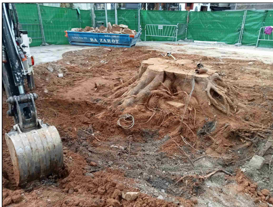
Foto: Excavación mecanizada y retirada de tierra del parterre de la plaza:

Prosiguiendo con los trabajos de destocoado, y una vez descubierto manualmente el perímetro alrededor del tronco, se utilizaron medios mecánicos, concretamente una retro mini para retirar y extraer el resto de la tierra del parterre así como se procedió a la demolición del bordillo perimetral. La futura plantación se plantea asegurando el buen anclaje del ejemplar a la cota actual de la plaza así como se minimizan los riesgos de elevación de cota en intervenciones posteriores sobre parterres elevados.