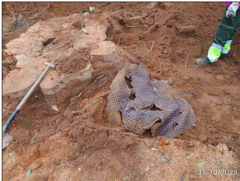
Foto: Localización de restos de material inerte impermeable alrededor del tocón

Esta estructura es notablemente perjudicial para el desarrollo y crecimiento del ejemplar tanto por su naturaleza impermeable como por su ubicación junto a la base del tronco. Sin dudas este hecho ha provocado que la migración del sistema radicular desde las cotas inferiores a las superiores haya sido casi testifical y deficiente, aumentando los efectos de la hipoxia de todo el sistema radicular del ejemplar.