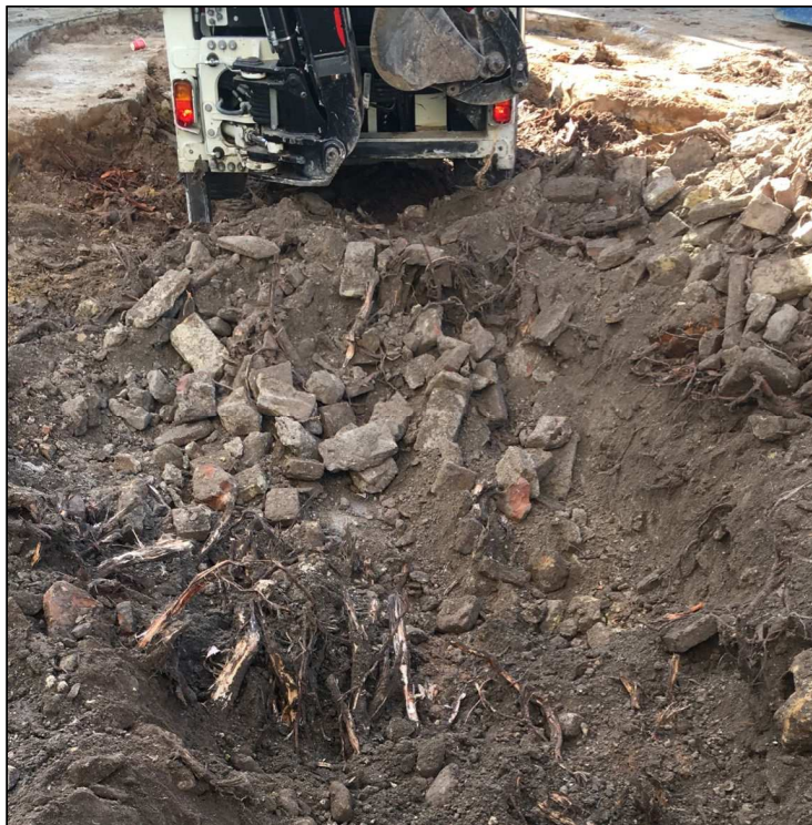
Foto: Presencia de numerosos restos de cableado y escombros alrededor del ejemplar

Esto evidencia claramente que la cota original de la plantación estaba incluso por debajo de la rasante actual de la plaza (ver foto anterior). Esta gran cantidad de residuos sin dudas han condicionado desfavorablemente la emisión de nuevas raíces del ejemplar y por tanto su adaptación a las nuevas condiciones de elevación de la cota del terreno.