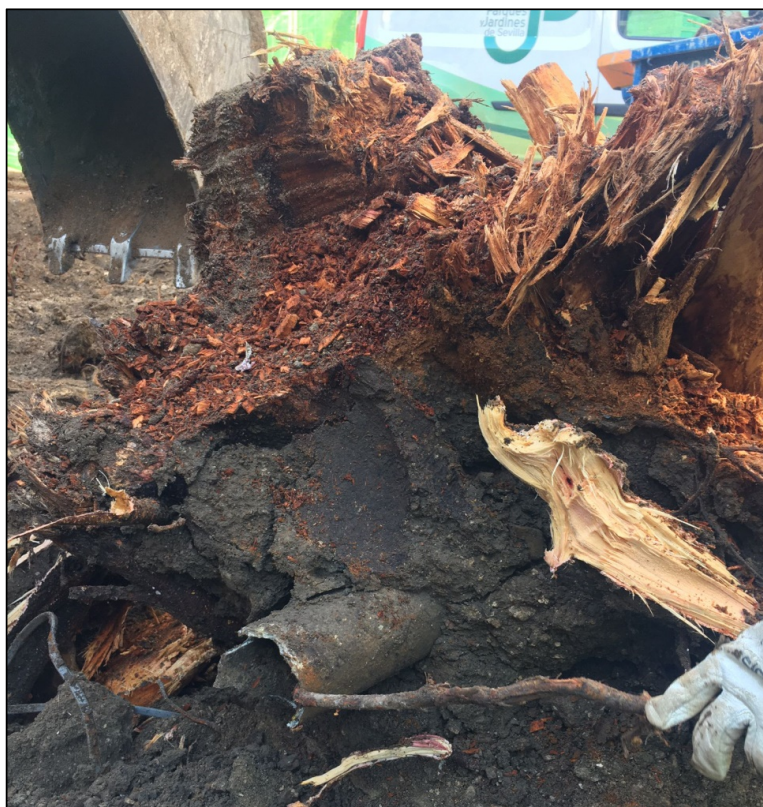
Foto: Vista del tocón invertido extraído: Ausencia de desarrollo radicular basal, podredumbre extensiva y presencia de agentes externos invasivos tipo cableado, arqueta y canalizaciones

La ausencia de desarrollo radicular en esta zona y su afección por hongos xilófagos con resultados patentes de avanzado estado de descomposición sin dudas han condicionado la vitalidad del ejemplar, siendo irreversible su estado fisiológico regresivo y fundamentalmente condicionando la estabilidad del resto de ramas primarias presentes, insertas desde la base del tocón y donde la extensión de los procesos enzimáticos y afección de la podredumbre era cuestión de corto - medio plazo, lo que sin dudas generaría alto riesgo de inestabilidad frente a vuelco por ausencia de anclaje en su zona pivotal y fundamentalmente frente a fractura de ramas primarias.