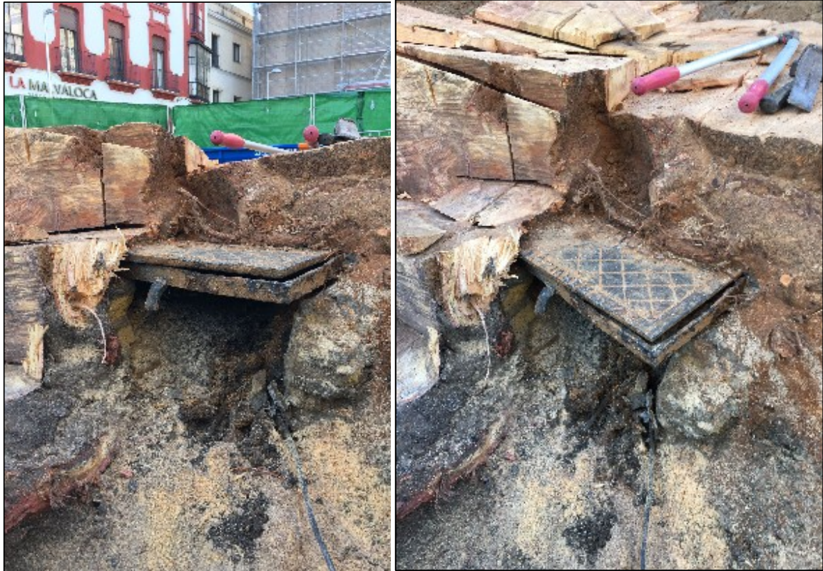
Foto: Hallazgos de arqueta metálica ubicada bajo el cuello basal radicular. Oquedad y pudrición avanzada

Con el proceso de destocoado, la oquedad y pudrición observada exteriormente, y adelantado su posible reflejo interno por los equipos de medición, se ha verificado que tiene su continuidad hasta el cuello principal de las raíces, y donde los daños por el procesos de pudrición y descomposición son más elevados incluso que los observados en la parte aérea del ejemplar. Tal y como se aprecia en la imagen anterior, se ha descubierto que el ejemplar fue plantado justo encima de una arqueta de fundición (incluso se aprecian los restos de cableado), condicionando vitalmente el desarrollo radicular del ejemplar en su zona más sensible, el cuello basal radicular.