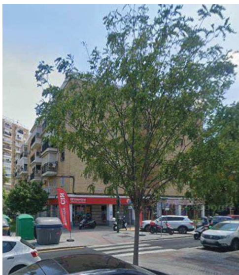
Imagen: Ejemplar tras incidencia, vuelto radicular (1 y 2); Ejemplar tras inspección en 2024.