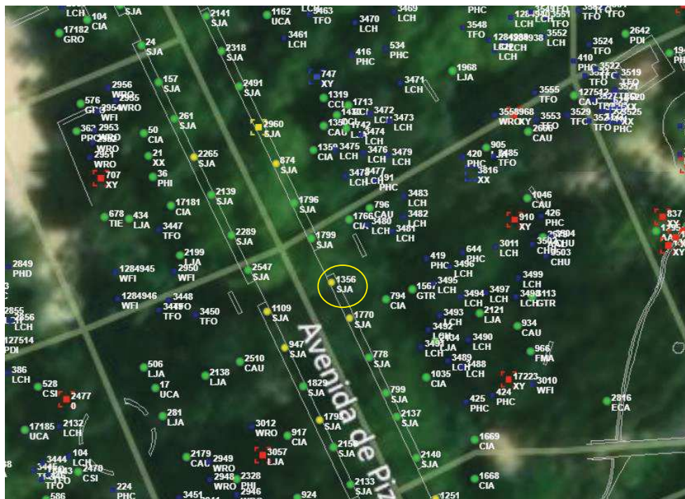
Localización del ejemplar de interés.