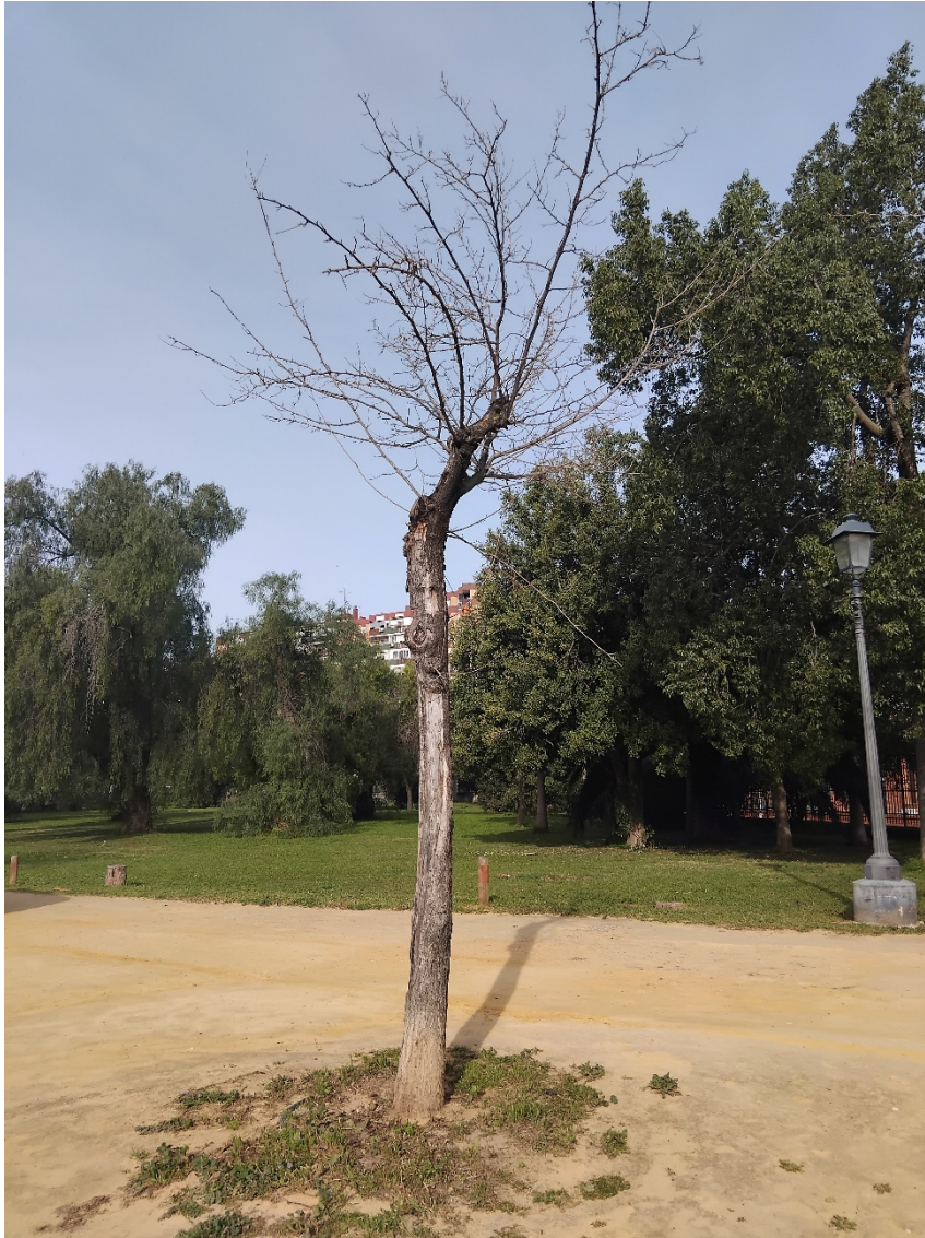
Vista detalle del estado del ejemplar en copa y zona radicular