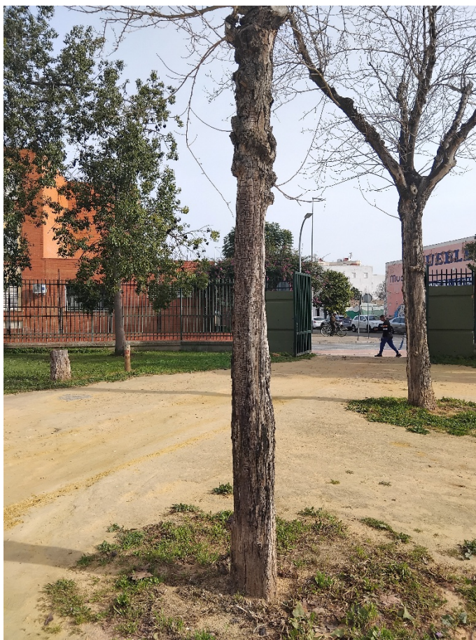
Vista detalle del estado del ejemplar en copa y zona radicular