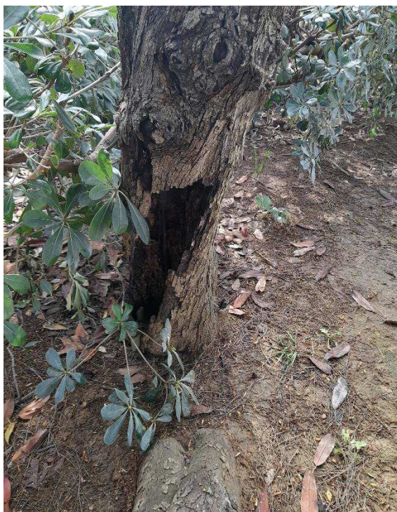
Estado general del árbol