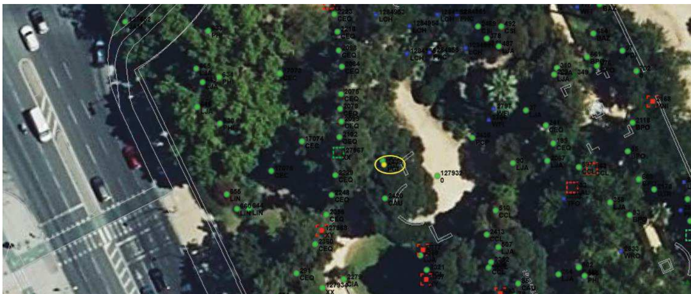
Localización del ejemplar