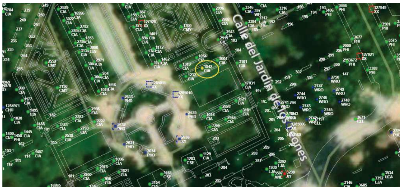
Localización del ejemplar de interés.