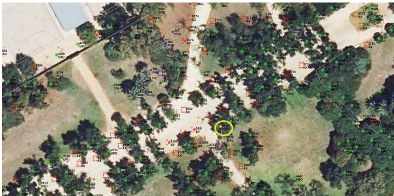
Localización del ejemplar de interés.