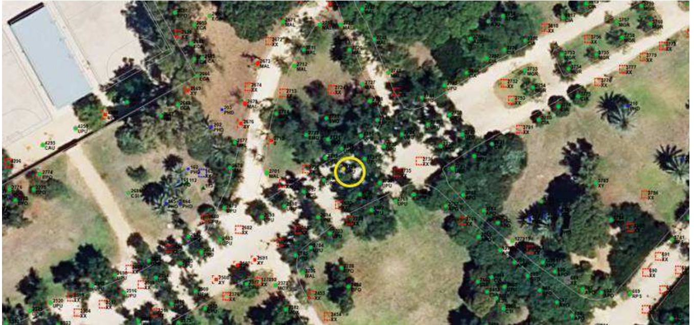
Localización del ejemplar de interés