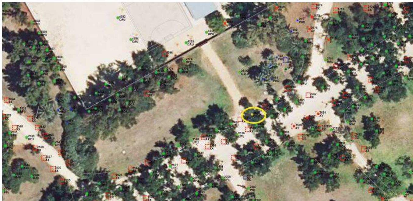
Localización del ejemplar de interés