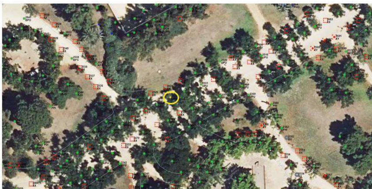
Localización del ejemplar de interés