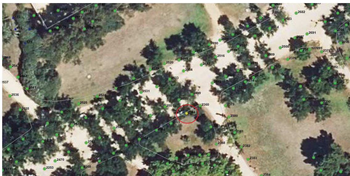
Localización del ejemplar de interés.