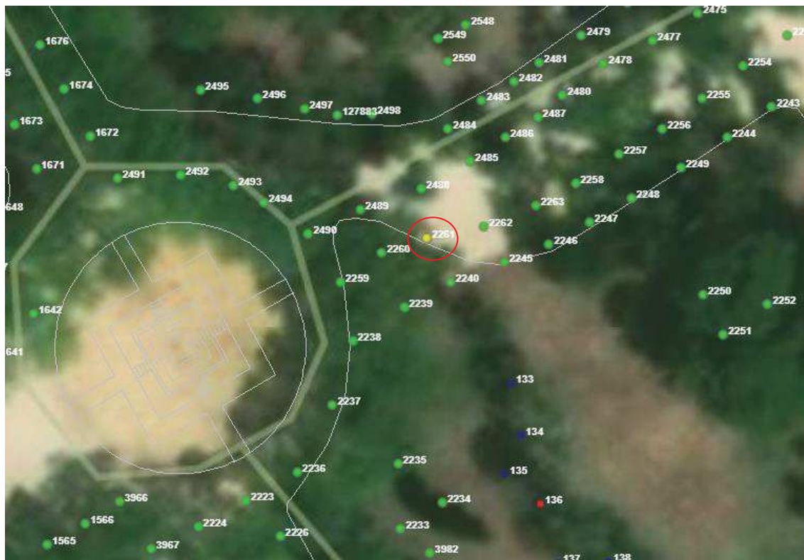
Localización del ejemplar de interés.