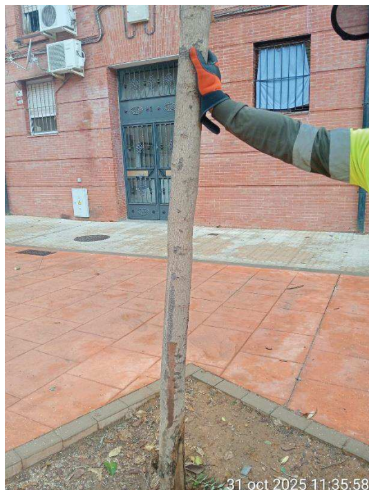
Imagen: ejemplar seco (1) y lesiones mecánicas en la base (2).