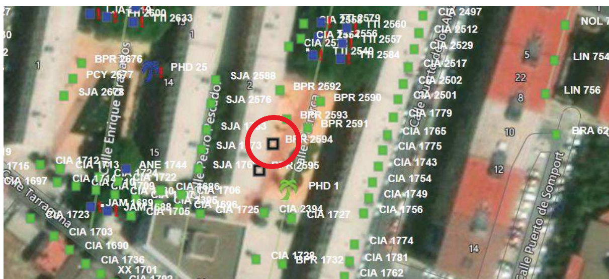
Imagen: BPR 2594.