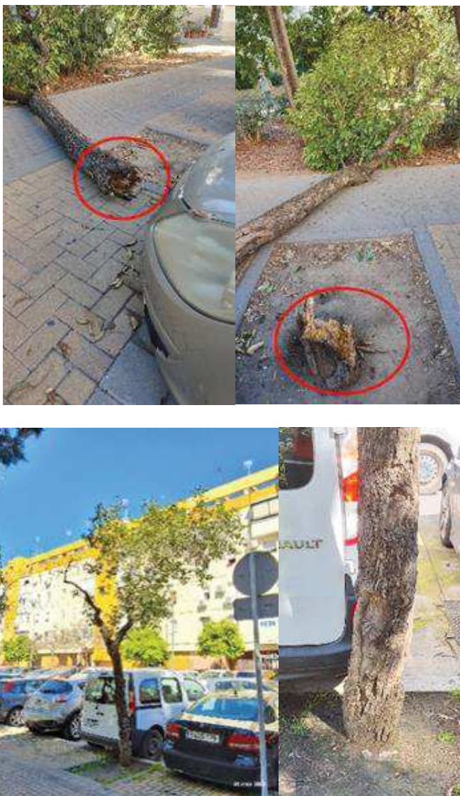
Imagen: lesiones graves a la altura del cuello (1 y 2); ejemplar tras inspección de marzo de 2025 (3 y 4)