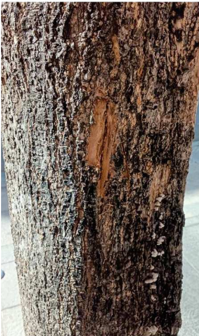
Pureba árbol seco