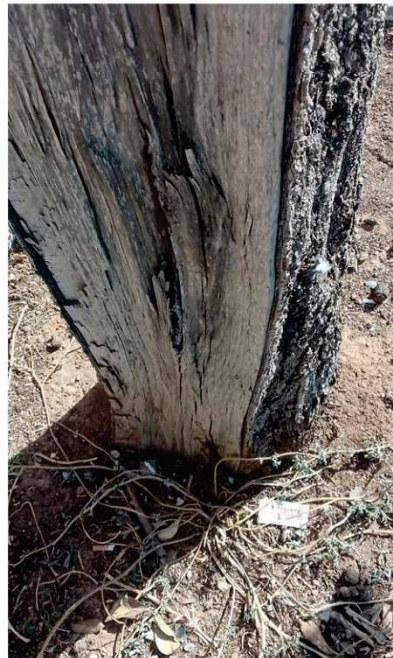
Herida longitudinal en tronco, síntomas de pudrición y cavidad