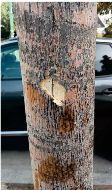
Prueba de árbol seco