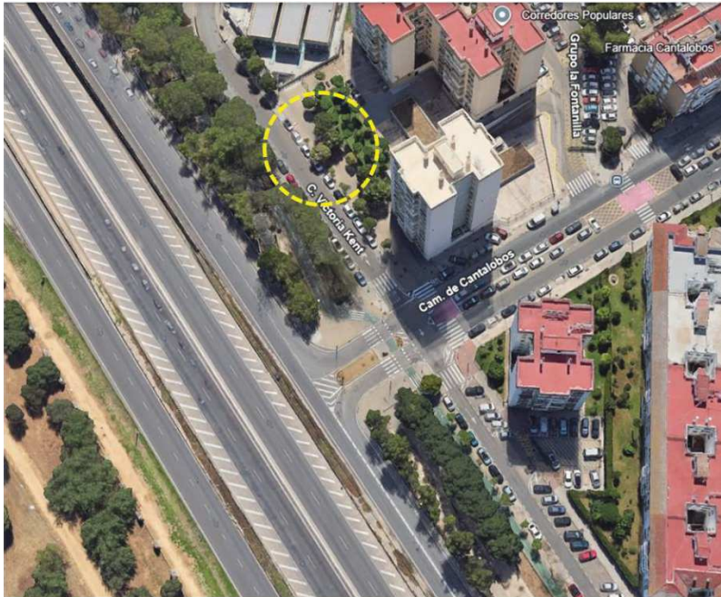
Localización: Calle Victoria Kent, distrito Macarena.