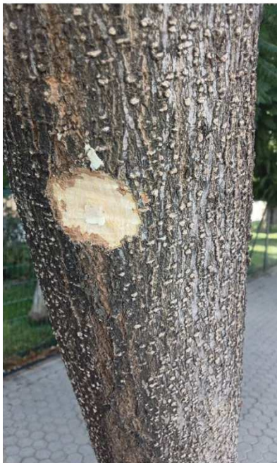
Prueba árbol seco