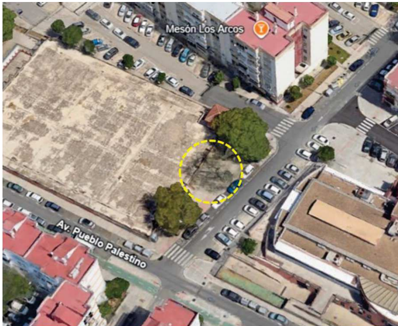
Localización: Calle Concha Caballero, distrito Macarena.