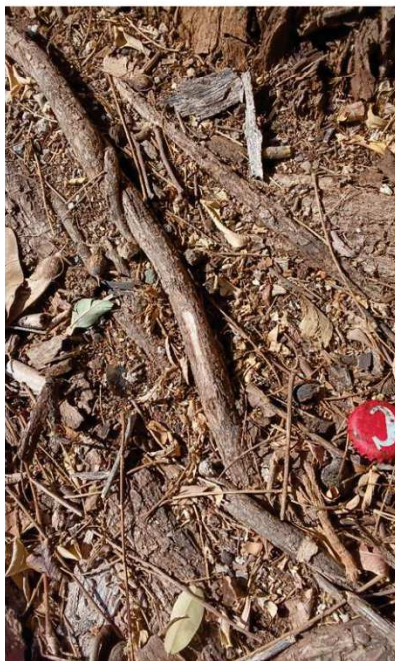
Prueba árbol seco