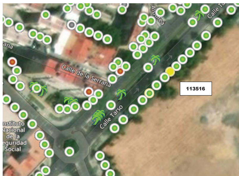
Localización del ejemplar en color amarillo