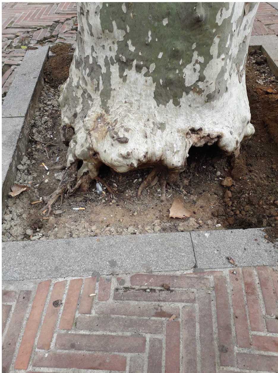
Ilustración 6. Lado con orientación SO