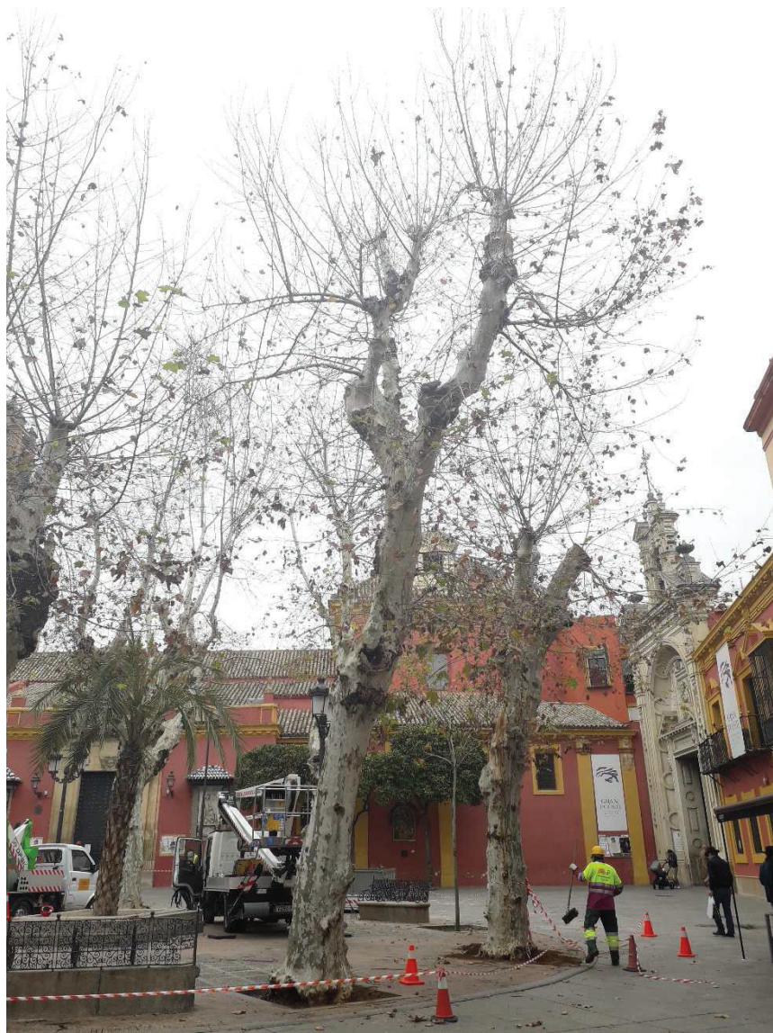
Ilustración 1. Vista general