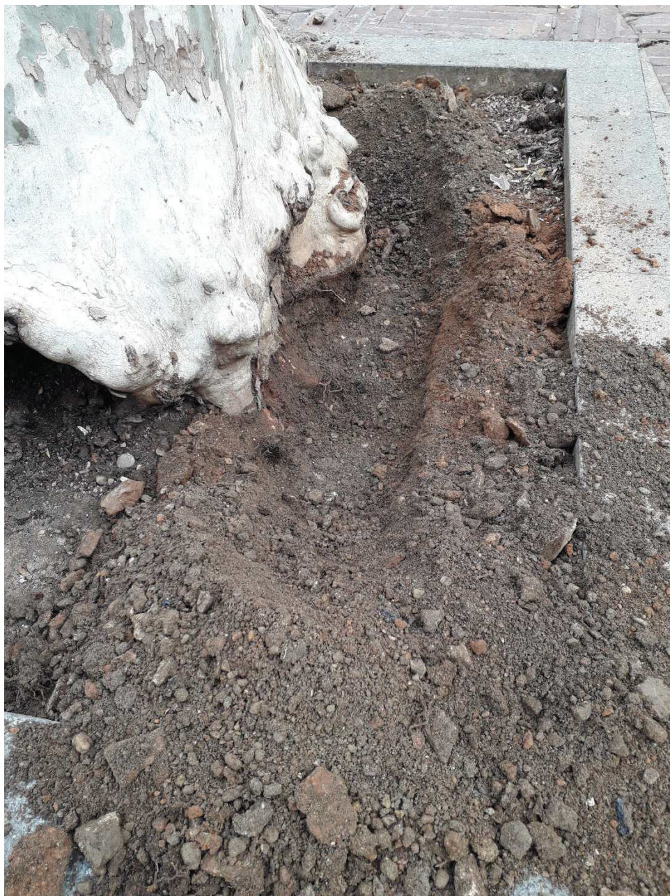
Ilustración 5. Lado con orientación SE