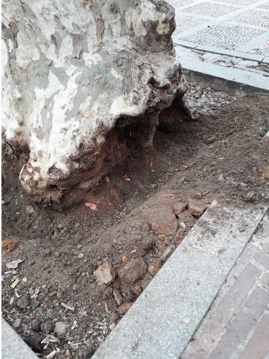
Ilustración 3. Lado con orientación NE