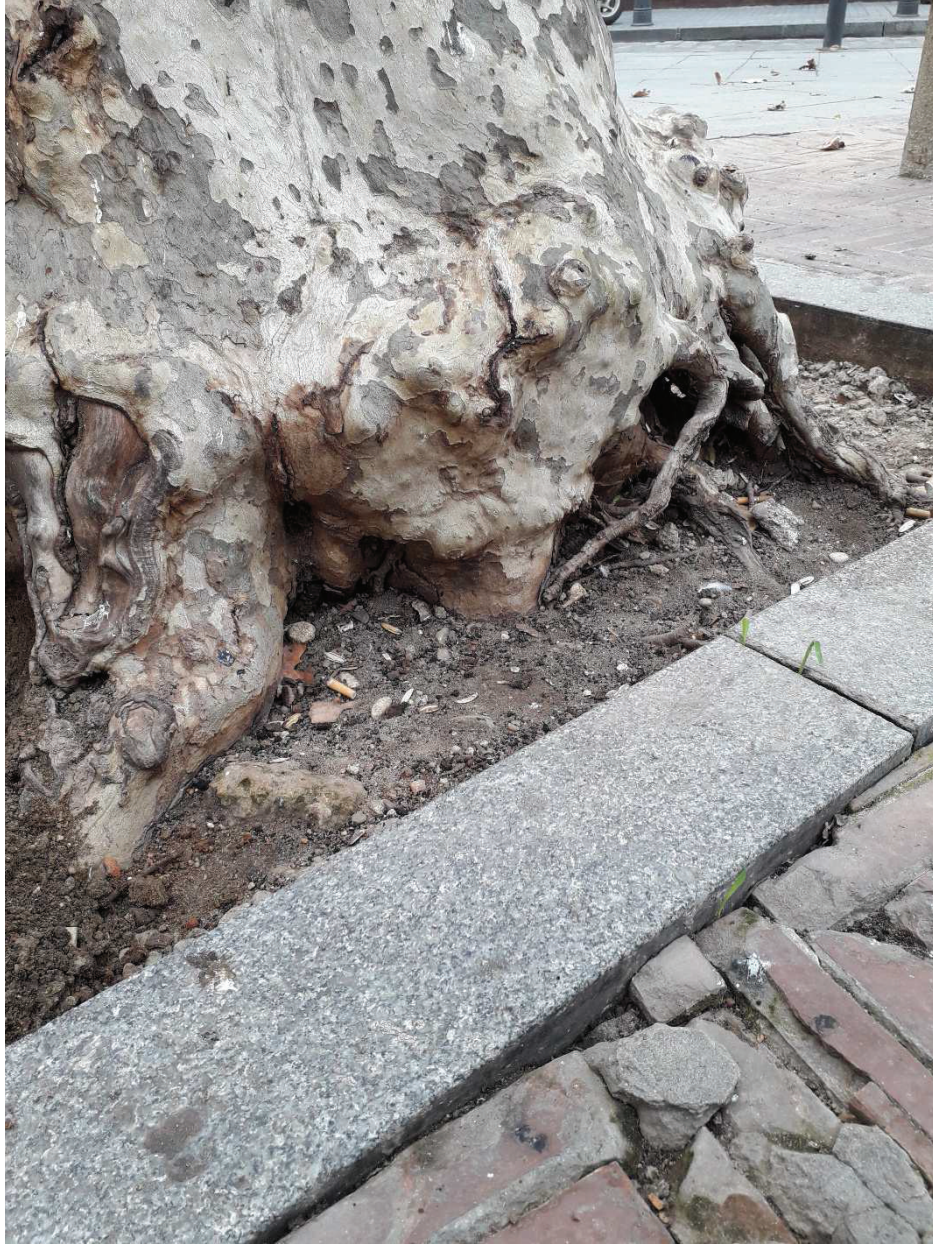
Ilustración 9. Lado con orientación NO