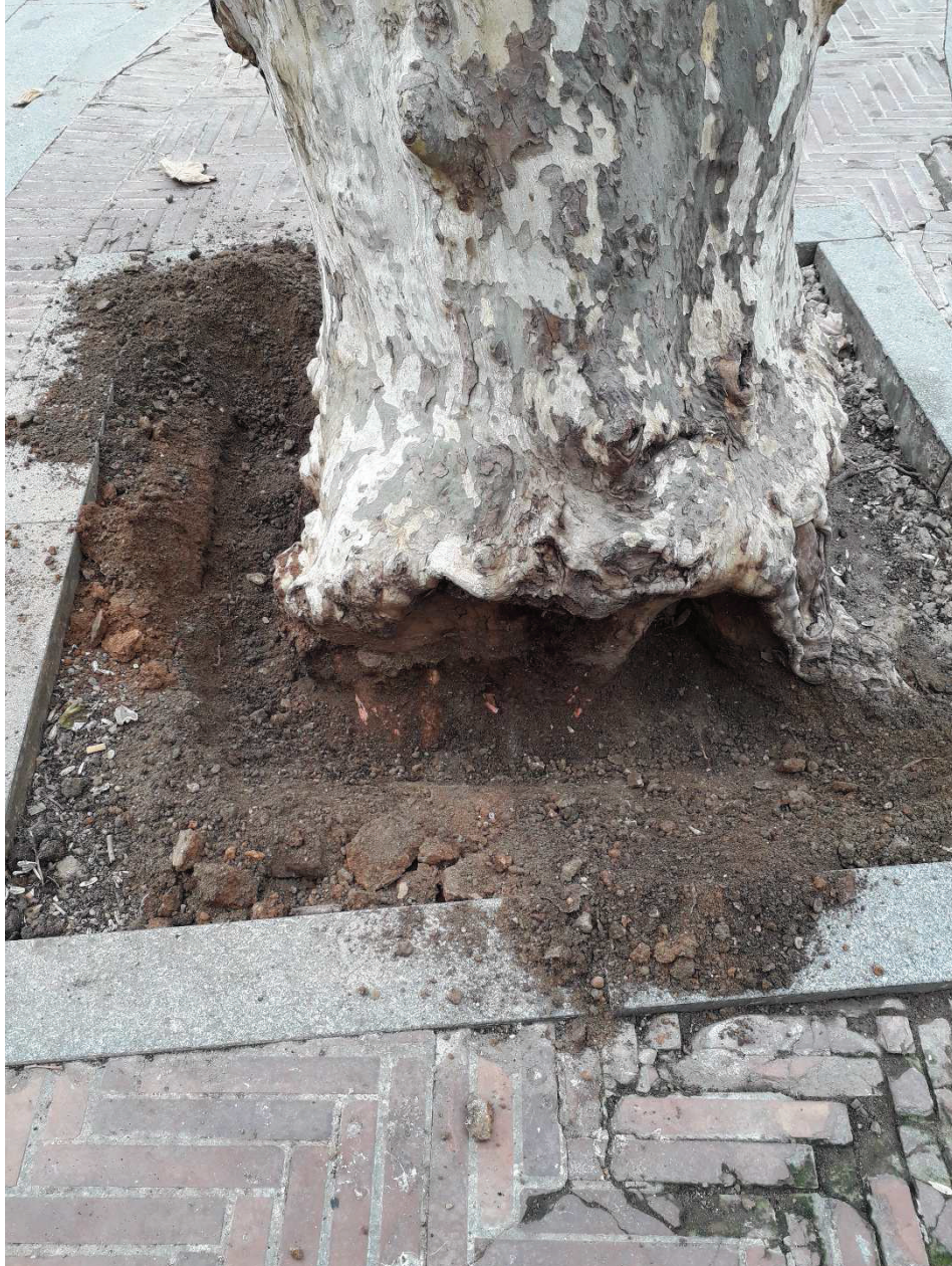
Ilustración 2. Lado con orientación NE