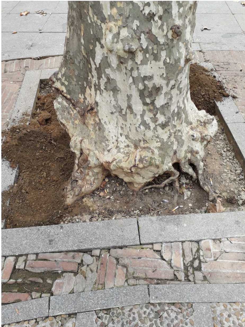
Ilustración 8. Lado con orientación NO