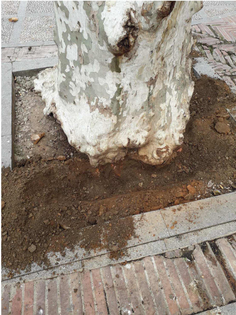
Ilustración 4. Lado con orientación SE