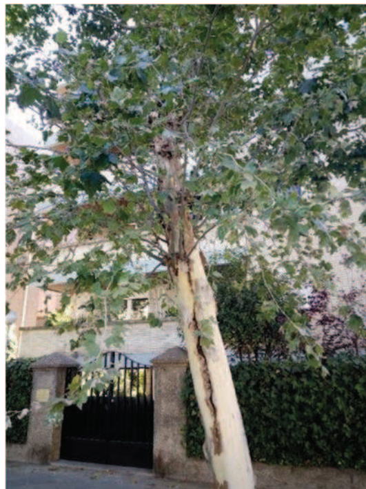
Vista del fuste con herida longitudinal