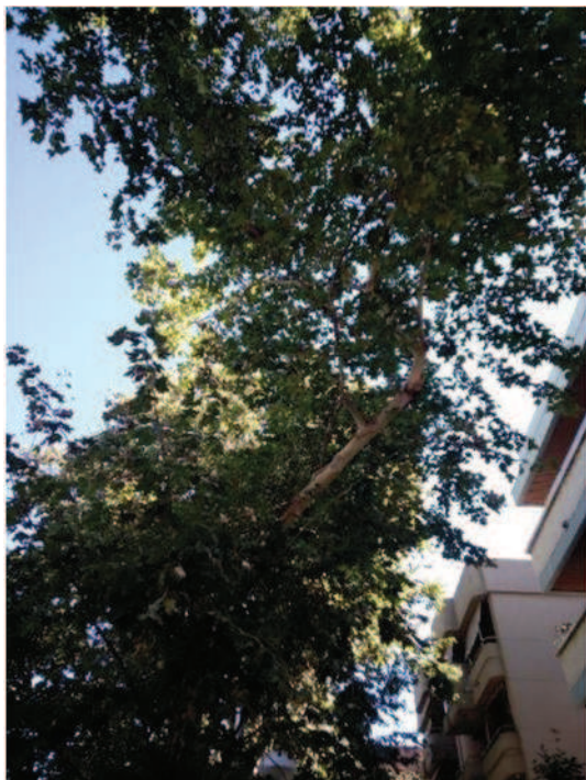
Vista del eje remanente