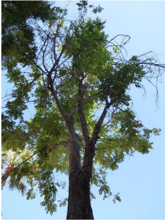
Vista de eje codominante seco