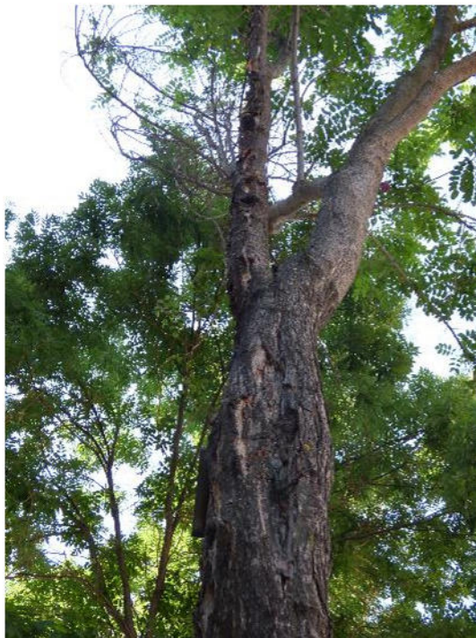
Vista de descortezamiento, corteza incluida y necrosis en cruz y eje seco