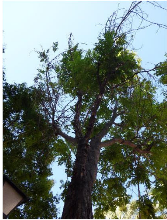
Vista de ramillas secas en eje activo