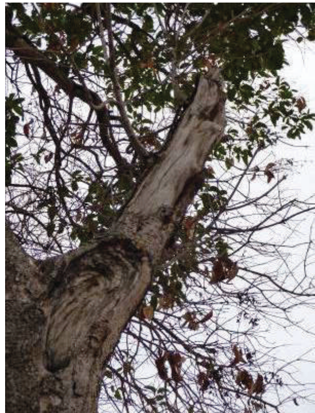
Vista de desgarro antiguo de eje principal