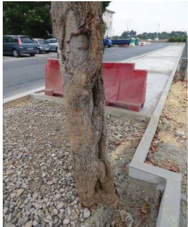
Vista de las lesiones del tronco