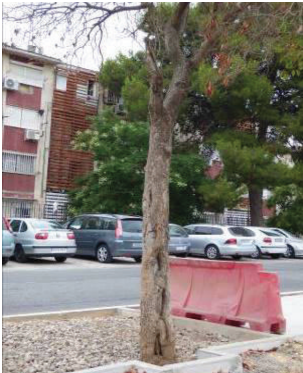
Vista del tronco y cruz principal