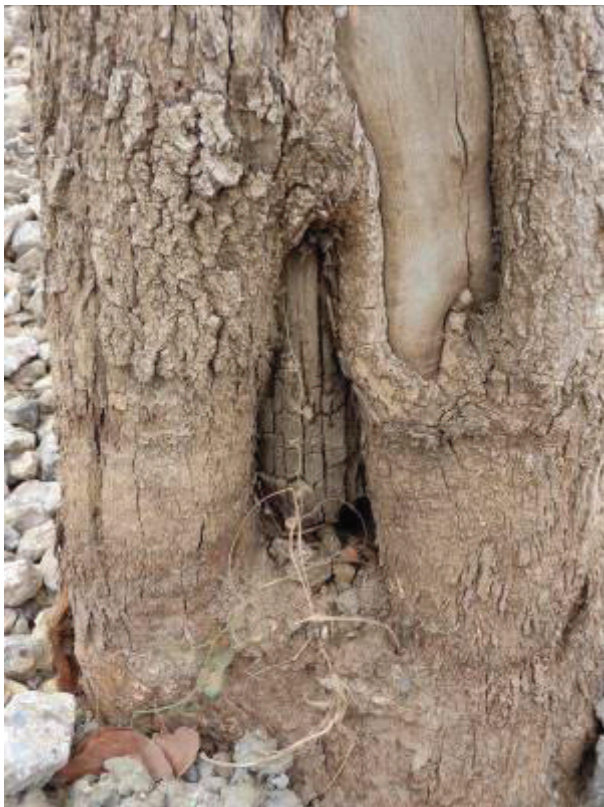
Detalle de pudrición en base del tronco (círculo rojo foto anterior)