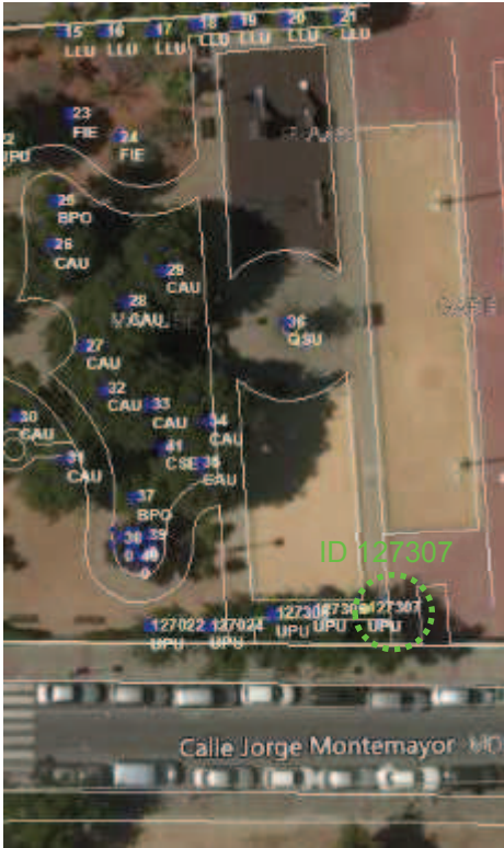
Localización: JARDINES PLAZA MANUEL GARRIDO