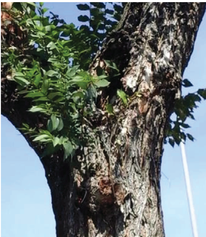
Detalle estructura primaria. Codominancia en primaria. Importante cavidad en plena cruz con grieta vertical