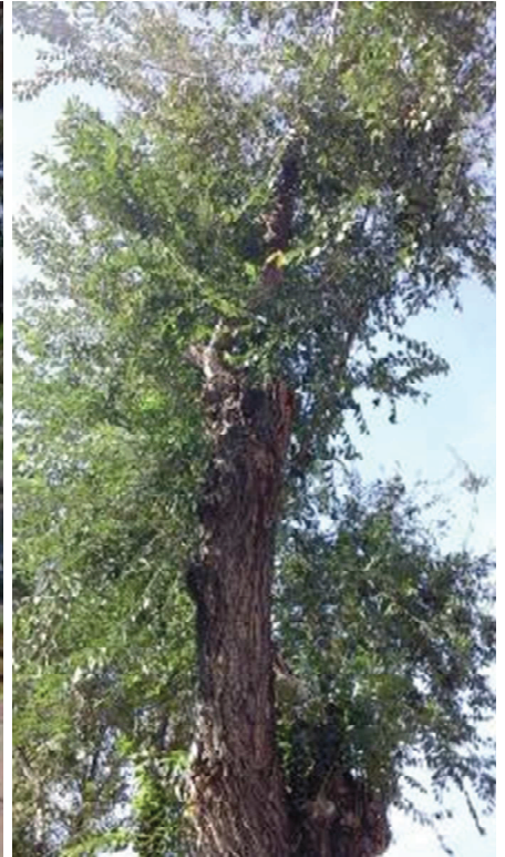
Detalle tocones y chupones sobre desmochado no consolidado