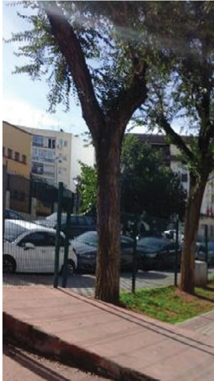
Vista general del árbol, desmochado