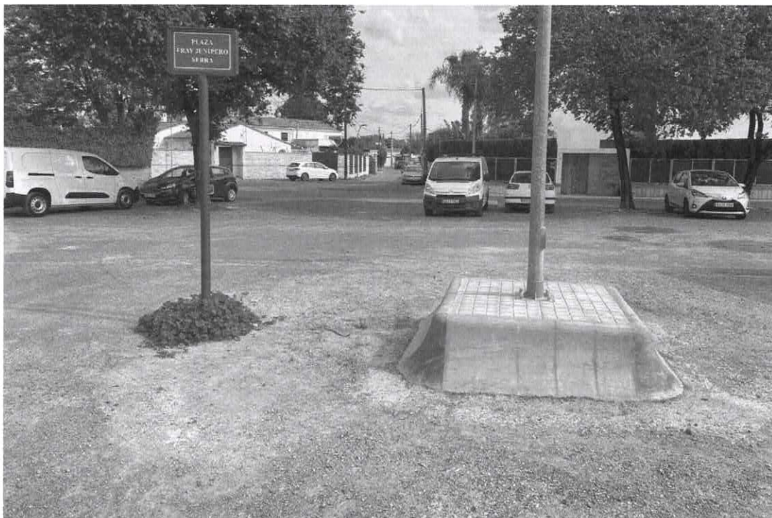
Isleta de protección de las luminarias de la plaza Fray Junípero Serra