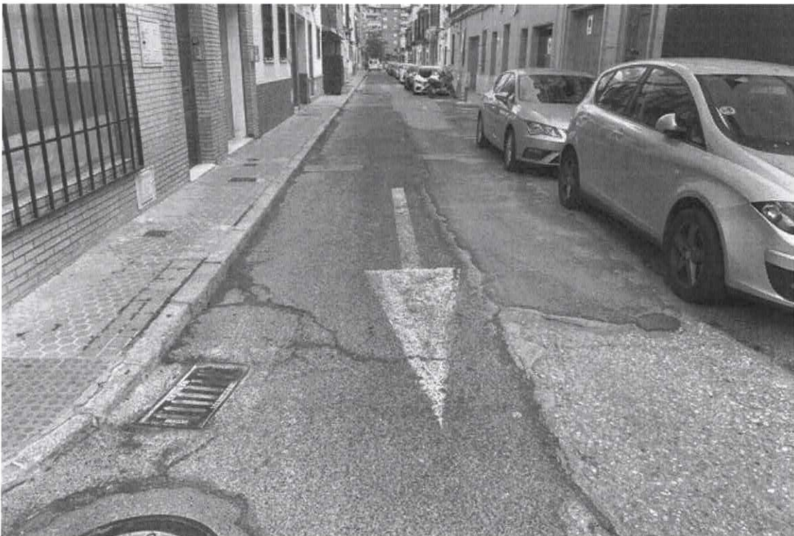
Fotografías del estado de las calles