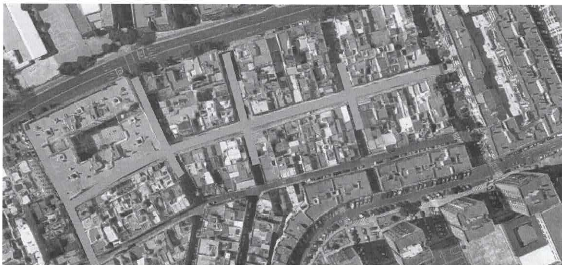
Visa aérea del área de actuación en el barrio del Fontanal