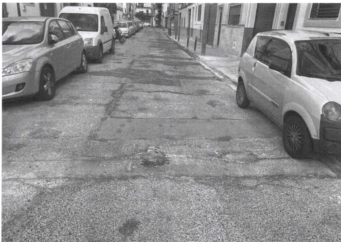
Fotografías del estado de las calles