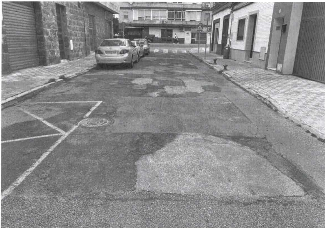
Fotografías del estado de las calles