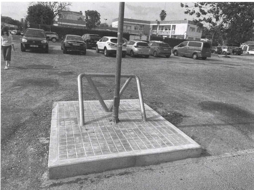
Isleta de protección y barreras metálicas en las luminarias de la plaza.