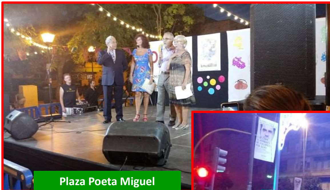
Plaza Poeta Miguel Hernández