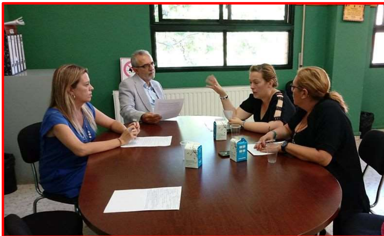
Reunión Admón. Nuevo Amate 25/09/18