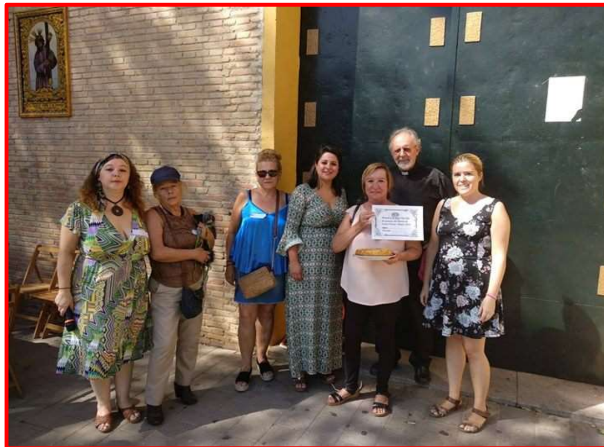
Asistencia convivencia Bda. Santa Teresa 07/10/18