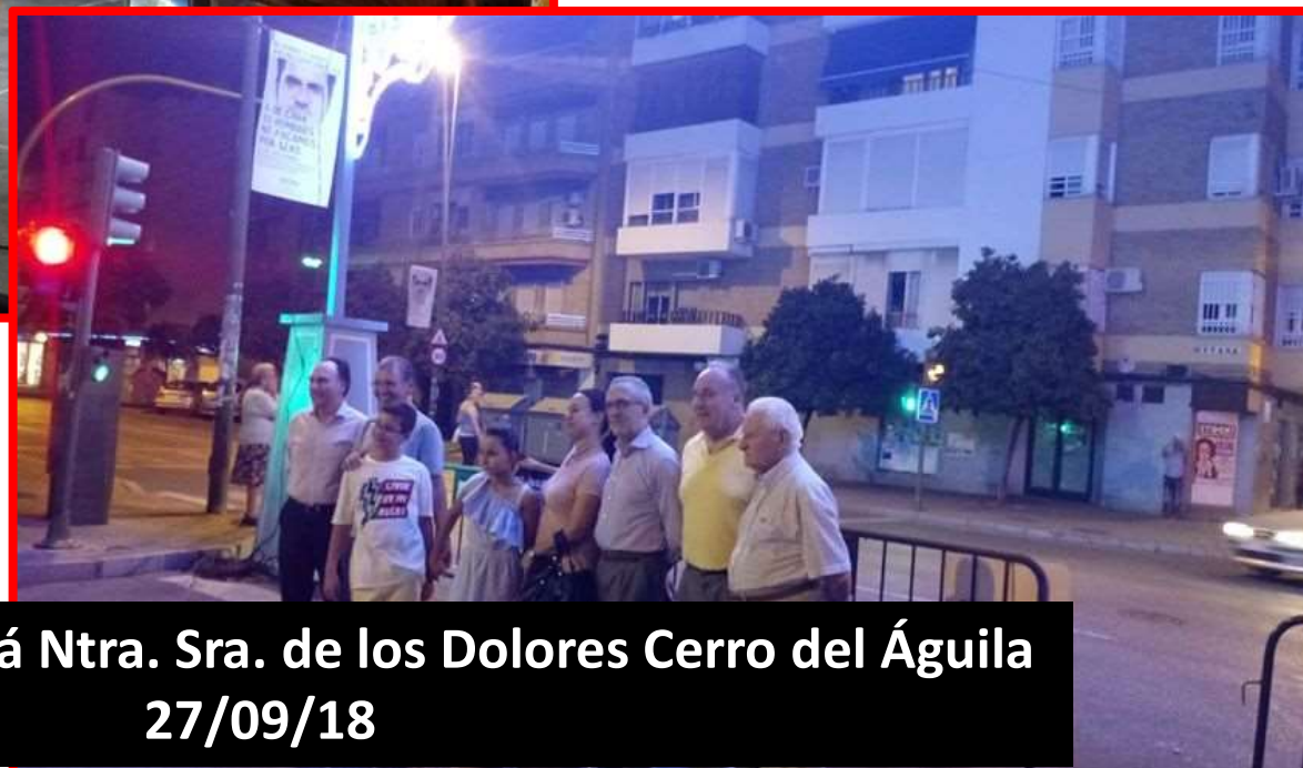
Inauguración 77º Velá Ntra. Sra. de los Dolores Cerro del Águila 27/09/18