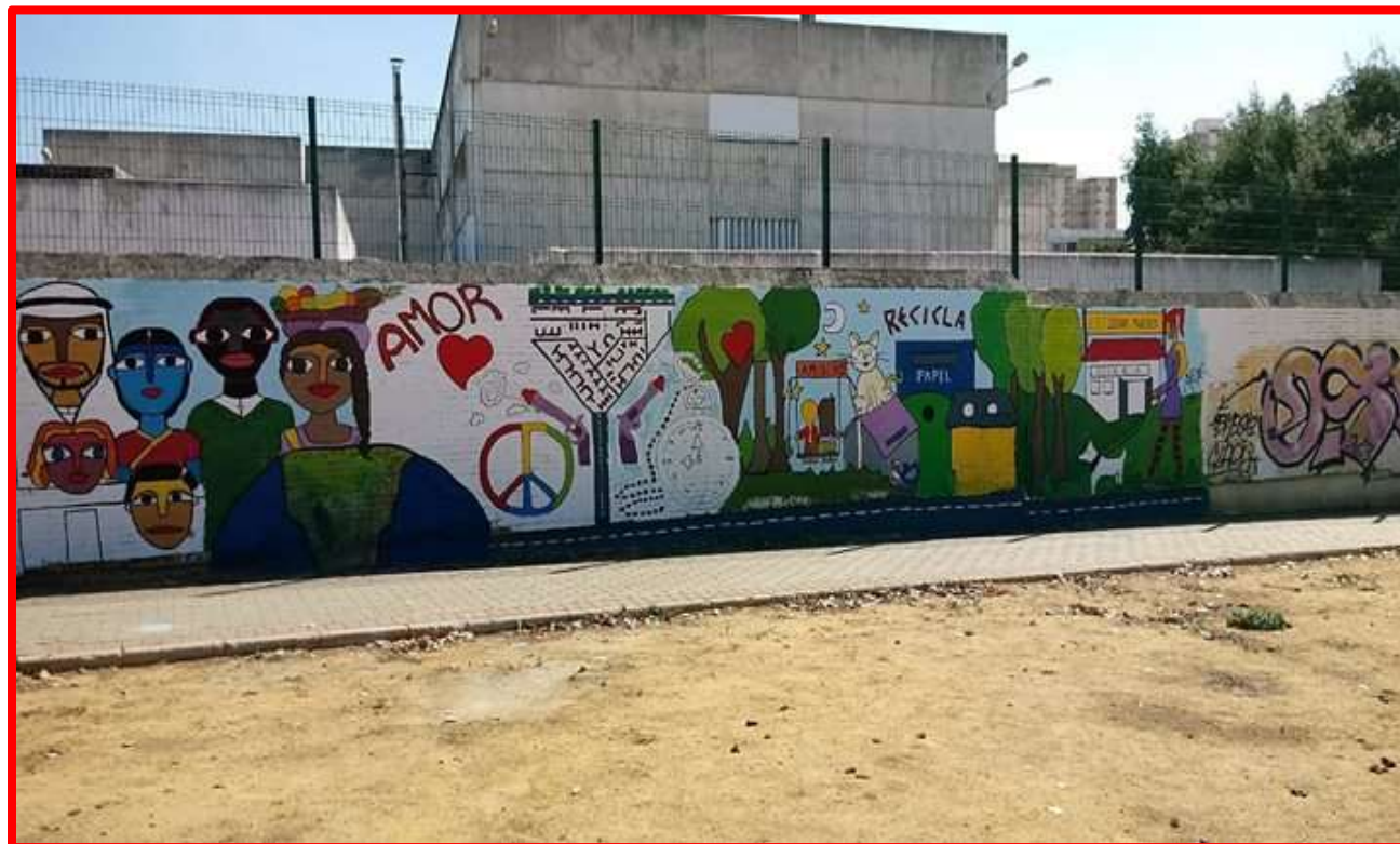
Mural Brigadas Muralistas en Plaza de Santa Teresa 07/10/18