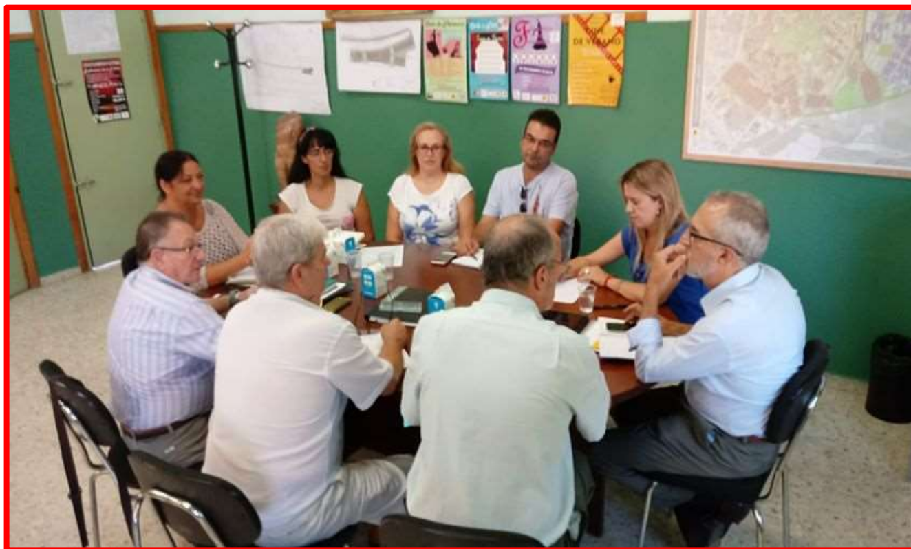
Reunión Coordinador de Asociaciones Sevilla 25/09/18